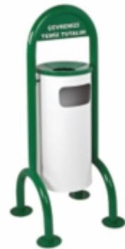
BAHÇE TİPİ ÇÖP KOVASI