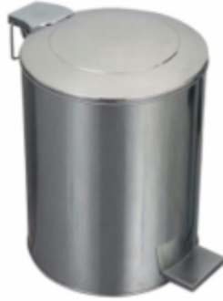
ENDÜSTRİYEL PEDALLI ÇÖP KOVASI