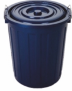
BATTAL BOY KİLİTLİ ÇÖP KOVASI