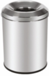
YANMAZ ÇÖP KOVASI