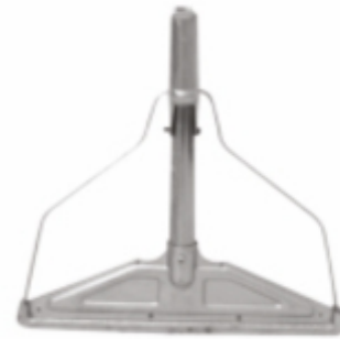
GENİŞ METAL YAYLI