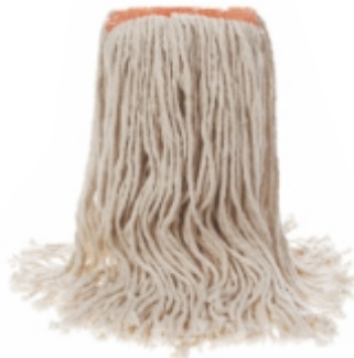
ISLAK MOP STANDART