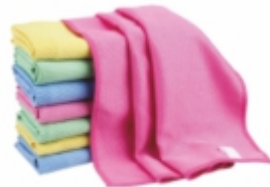
MİKROFİBER CAM BEZİ