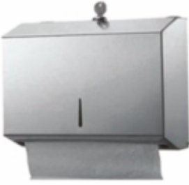
KROM 200 KPS DİSPENSER HAVLU APARATI