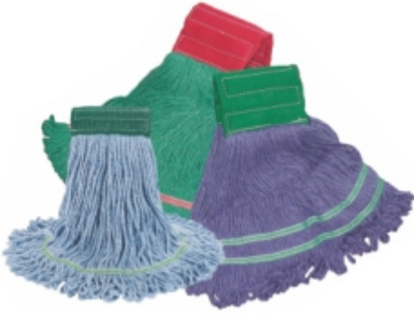
ISLAK MOP LUX 500 gr