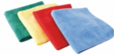
MİKROFİBER HAVLU BEZ