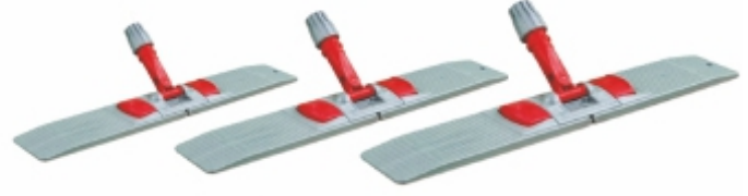
NEMLİ MOP PALET APARATLAR 40 - 50 - 60 -80 cm