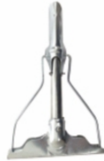
DAR METAL YAYLI