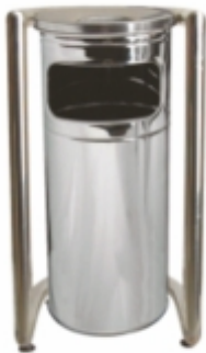
OFİS TİPİ ÇÖP KOVASI