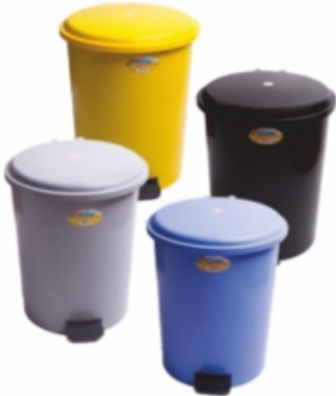
PEDALLI ÇÖP KOVALARI (PLASTİK)