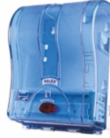
FOTOSELLİ HAVLU MAKİNESİ 21 cm