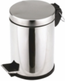
PEDALLI ÇÖP KOVASI