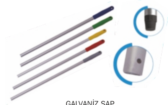
GALVANİZ SAP VİDALI-DELİKLİ