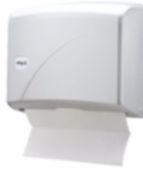
DİSPENSER HAVLU APARATI