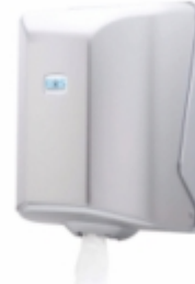
İÇTEN ÇEKME HAVLU APARATI