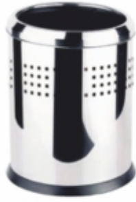
ÇEMBERLİ ÇÖP KOVASI